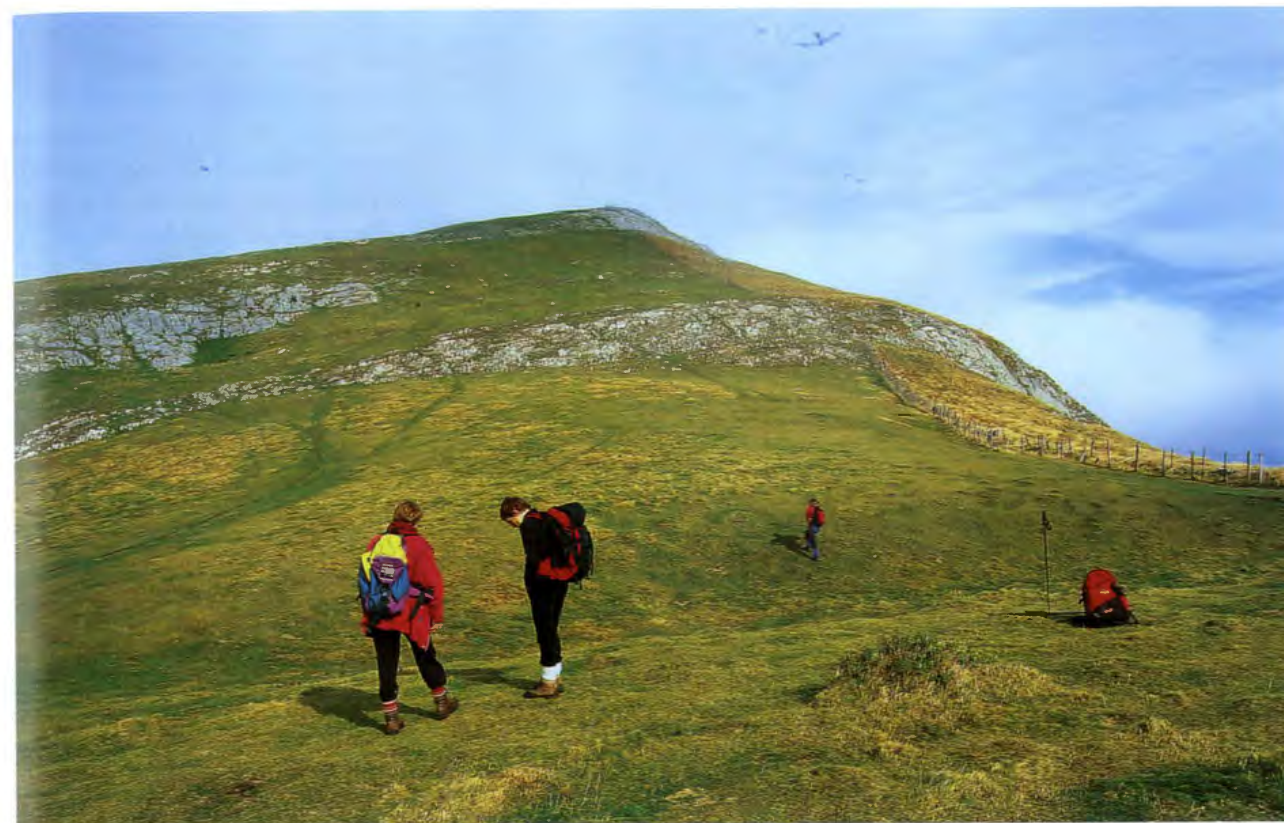
■ Uniko Pelota Lekue, rrellano situado al pie de Uakorri.