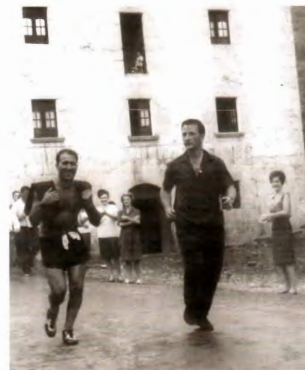
■ Finalizando la prueba en Amezketa.