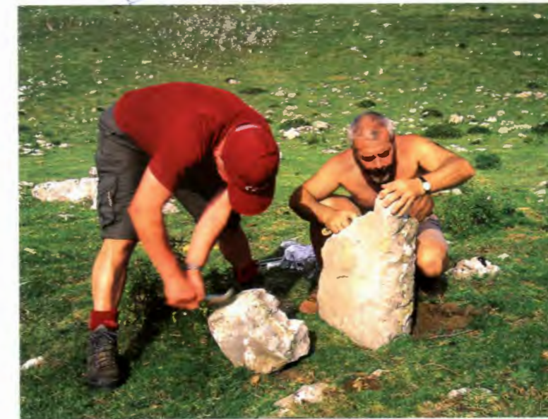
■ Restaurando la piedra de Zealar (10-9-2006).