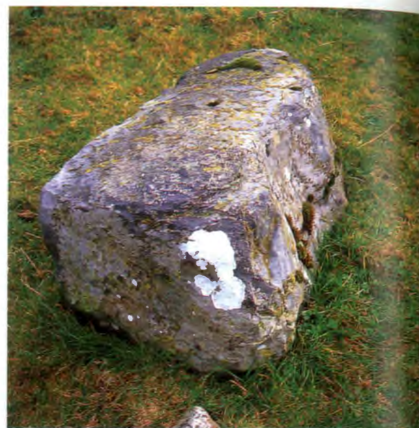
■ La pesada mole de Aintziko Harria.